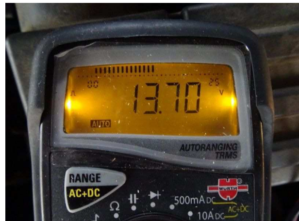
Leistung der Lichtmaschine / in Ordnung