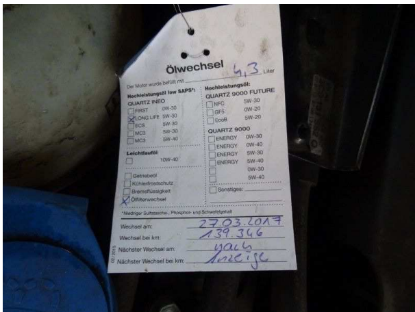
Ölzetteln im Motorraum