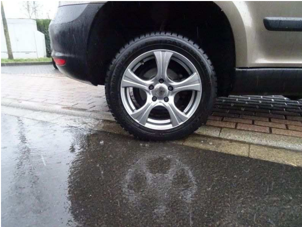
Rad hinten rechts