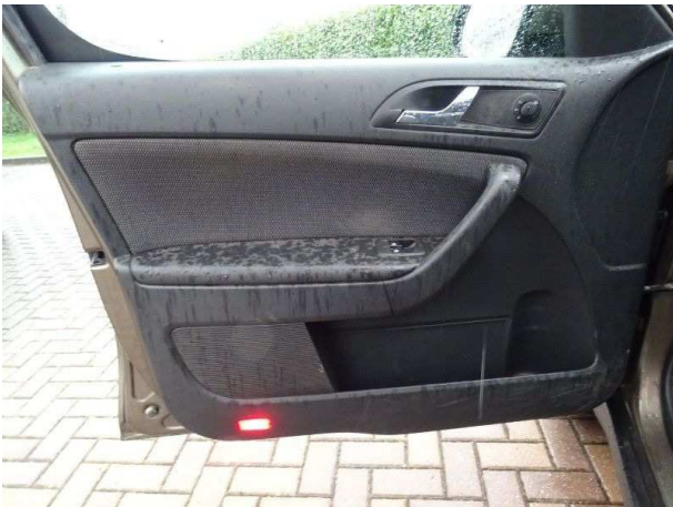
Türverkleidung vorne links