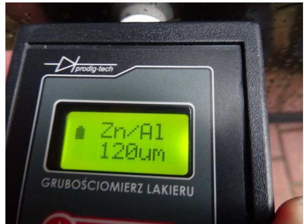
Lackdicke Tür hinten links / in Ordnung