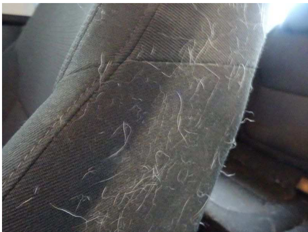
Beifahrersitz / Hundehaare