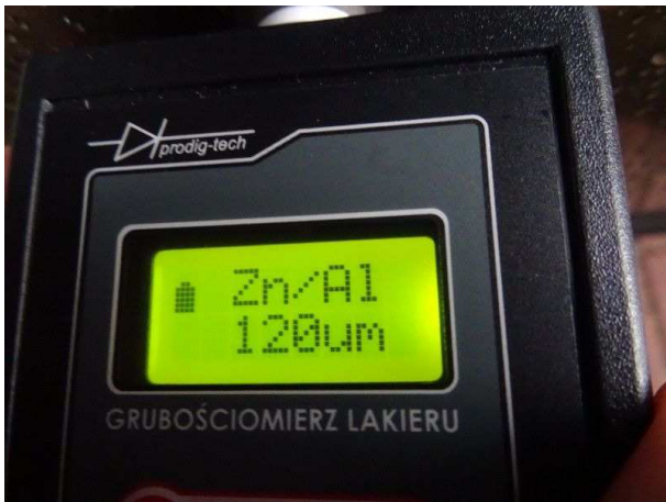
Lackdicke Tür vorne links / in Ordnung