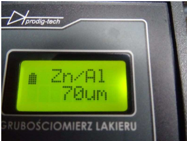
Lackdicke Seitenteil links / in Ordnung