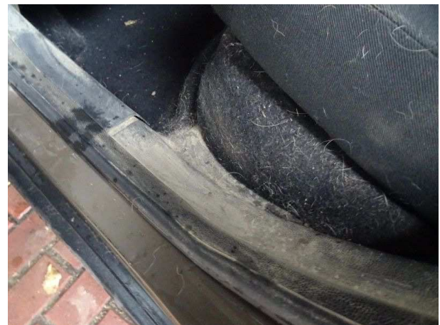
Verschmutzung hinten links Innenraum