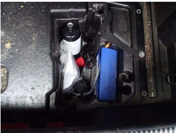
Reifen Reparatur Set