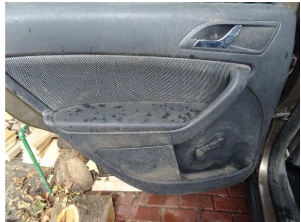
Türverkleidung hinten links / Schmutz