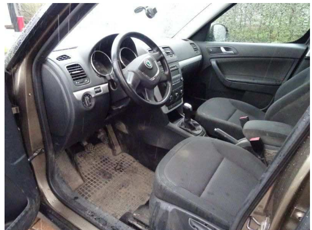
Innenraum von links