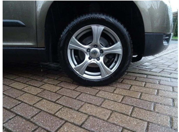
Rad hinten rechts