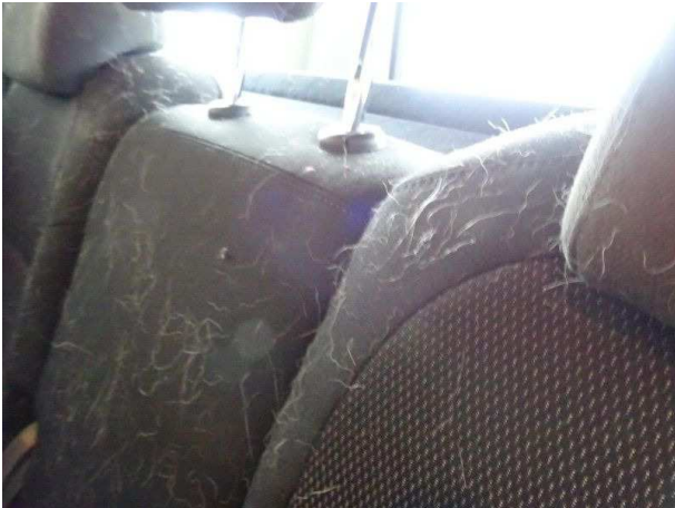
Rücksitzbank / Hundehaare