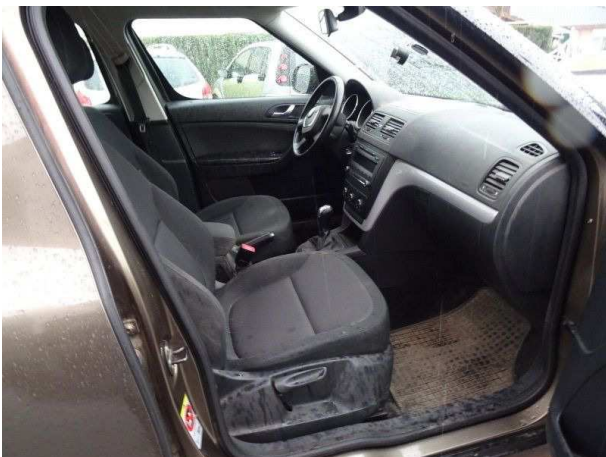
Innenraum von rechts