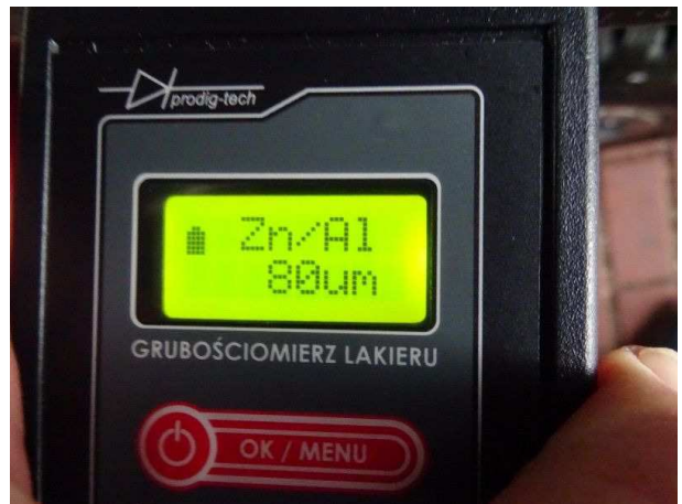
Lackdicke Kotflügel links / in Ordnung